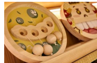
cocomoお豆の収穫、ハッピーティース