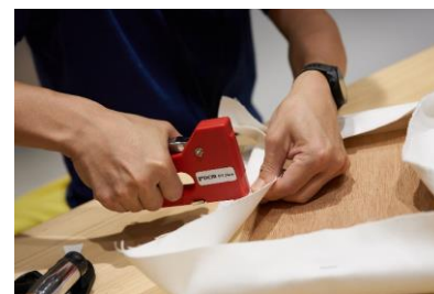
③ タッカーで留めれば完成！