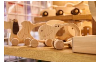
cocomoアニマル&カーシリーズ