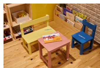
檜キッズベンチキット、チェア、テーブル