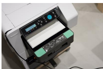
① 印刷する写真を専用のアプリへ 転送し、プリンターで印刷