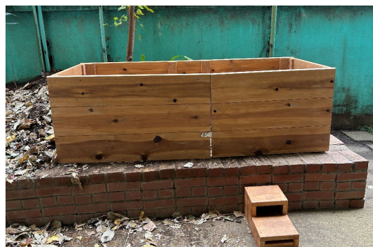
臨川幼稚園に設置したコンポスの柵