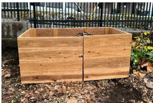
臨川小学校に設置したコンポスの柵

児童たちが丹精込めて作り上げたコンポスの柵は、小学校と隣接する幼稚園のそれぞれの指定場所に設置されました。DCM DIY placeが提供した杉材の温もりと児童自らが打ったビスの一本一本に、ものづくりの達成感が刻まれています。この柵は、集められた落ち葉が良質な土へと生まれ変わるための大切な「器」となります。今後、自分たちの手で作った土を使って野菜や花を育てるとい、次の探究学習に向けた確かな土台が完成しました。