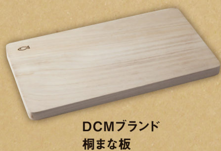
DCMブランド 桐まな板