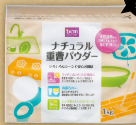
DCMブランド ナチュラル重曹パウダー