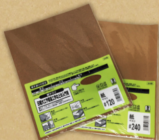
紙ヤスリ #120 紙ヤスリ #240