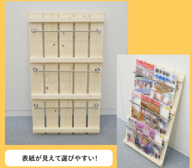
表紙が見えて選びやすい!

すのこを使ったブックシェルフの作り方を紹介します! 表紙が見えるように置けるので、 お気に入りの雑誌や本を飾ると気分が上がりますよ!