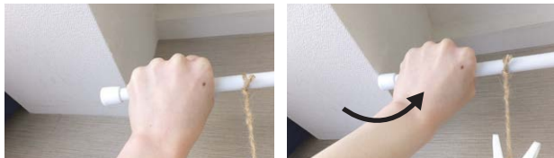
長めに伸ばしておいて...

つっぱり棒を取り付ける際、取り付ける幅の長さよりも長めに伸ばしておき、隙間に押し込むようにして取り付けるとつぱりの強度が増します。